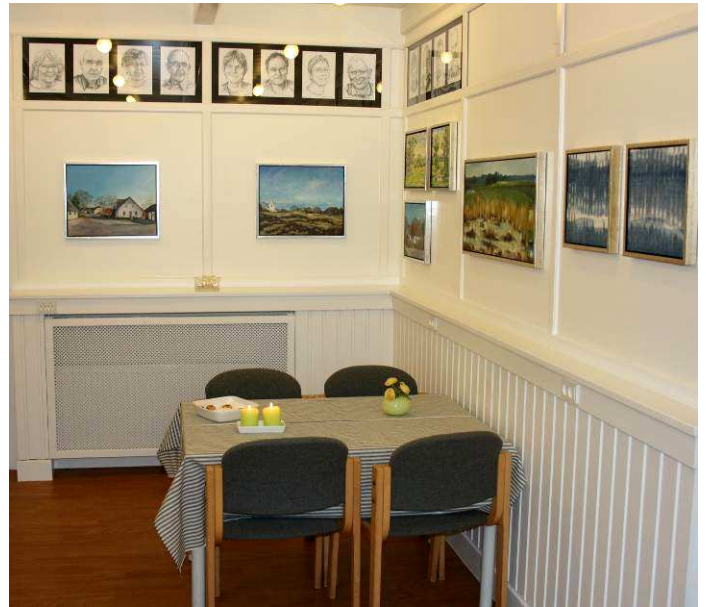
Ny istandsat forsamlingshus i Lundby (som et eksempel)

AKA-puljens næste ansøgningsrunde d. 1. oktober 2012 er også for forsamlingshuse, og her vil bestyrelsen søge om penge til materialer, mens selve arbejdet skal udføres vha. frivillig arbejdskraft. Derfor opfordrer bestyrelsen alle til at sponsere nogle arbejdstimer. Så støt Forsamlingshuset med 5, 10 eller 20 arbejdstimer, eller hvor mange du nu synes du kan magte.