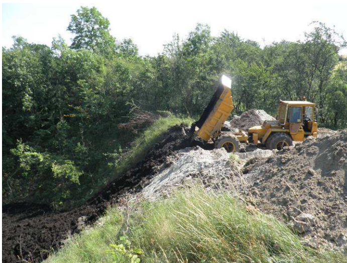
Der er givet tilladelse til at deponere opgravet materiale fra mølledammen i råstofgraven ved Damvej bag Huulmøllevvej 7.

Samtidig vil vi også gerne beklage, hvis man i området føler sig generet af al den tunge arbejdskørsel. Det kan desværre ikke være anderledes, men vi håber at resultatet til sidst bliver så vellykket, at generne bliver skubbet i baggrunden.