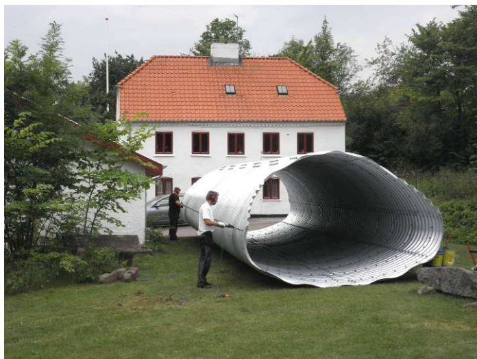
Stålrøret under broen blev samlet og malet på græsplænen ved Huulmøllevvej 7, hvorefter det blev hejst på plads i stryget af en kran.