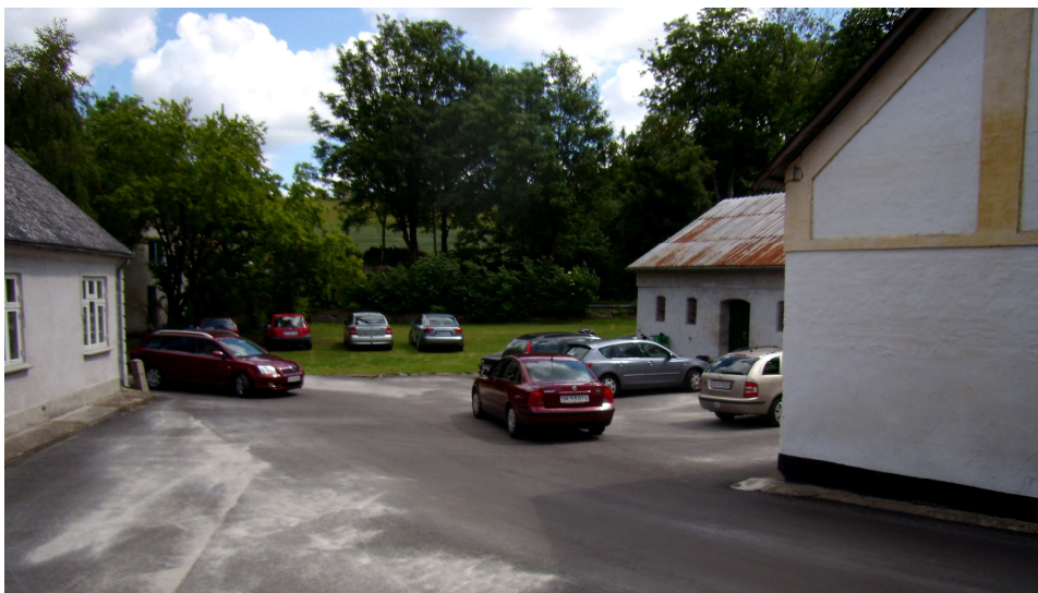
Der var til tider trængsel i gården

Det blev så et stort tilløbsstykke, at bestyrelsen til sidst opgav at tælle de besøgende, men et godt gæt er et sted mellem 75 og 100 . Antallet af besøgene kom fuldstændigt bag på bestyrelsen, men det var rigtigt dejligt at mærke så stor en interesse.