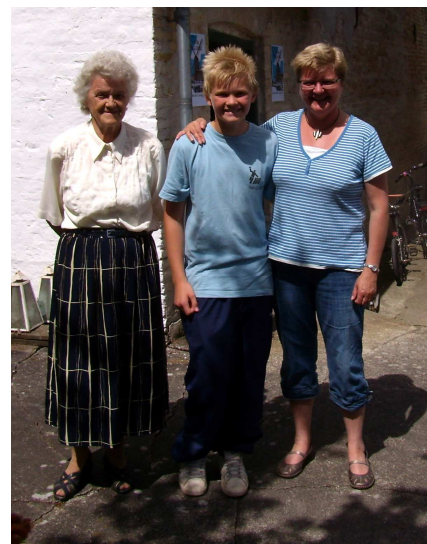
3 generationer af Hyldahl-familien.

Under besøget blev der solgt projekthæfter til støtte for restaureringen, og tegnet nye medlemskaber, så medlemslisten nu omfatter 78 betalende medlemmer. Dette er også langt mere end bestyrelsen oprindeligt havde sat som mål, og fortæller at interessen for at få Huul Mølle bevaret er stor.